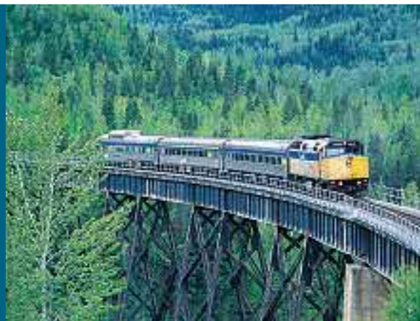
© «Le Skeena» de VIA Rail, Tourisme Colombie-Britannique