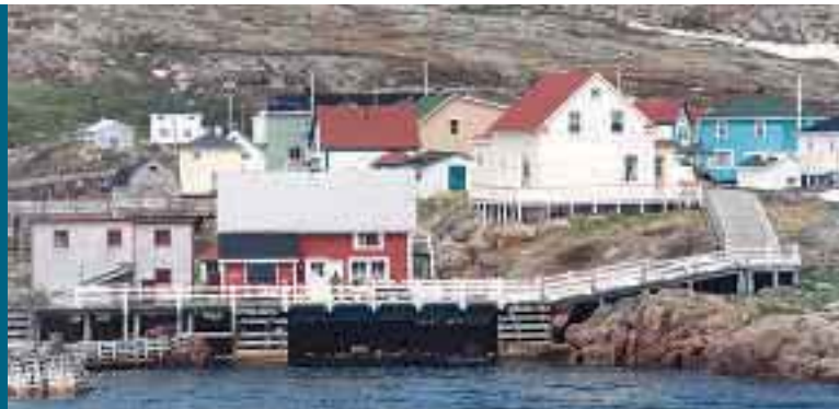
© Harrington Harbour, Association touristique régionale de Duplessis