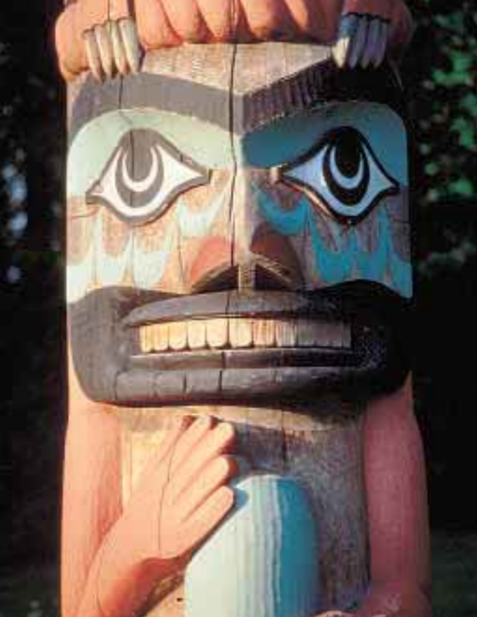
© Tofino, île de Vancouver, Tourisme Colombie-Britannique