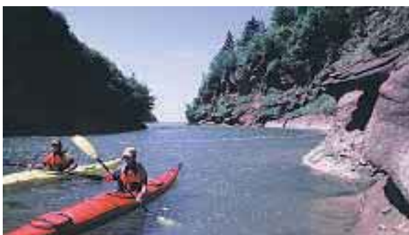
© Baie de Fundy, Bureau du tourisme du Nouveau-Brunswick