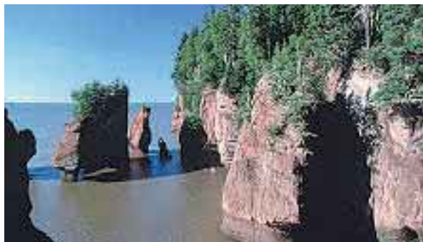
© Hopewell Rock, Bureau du tourisme du Nouveau-Brunswick