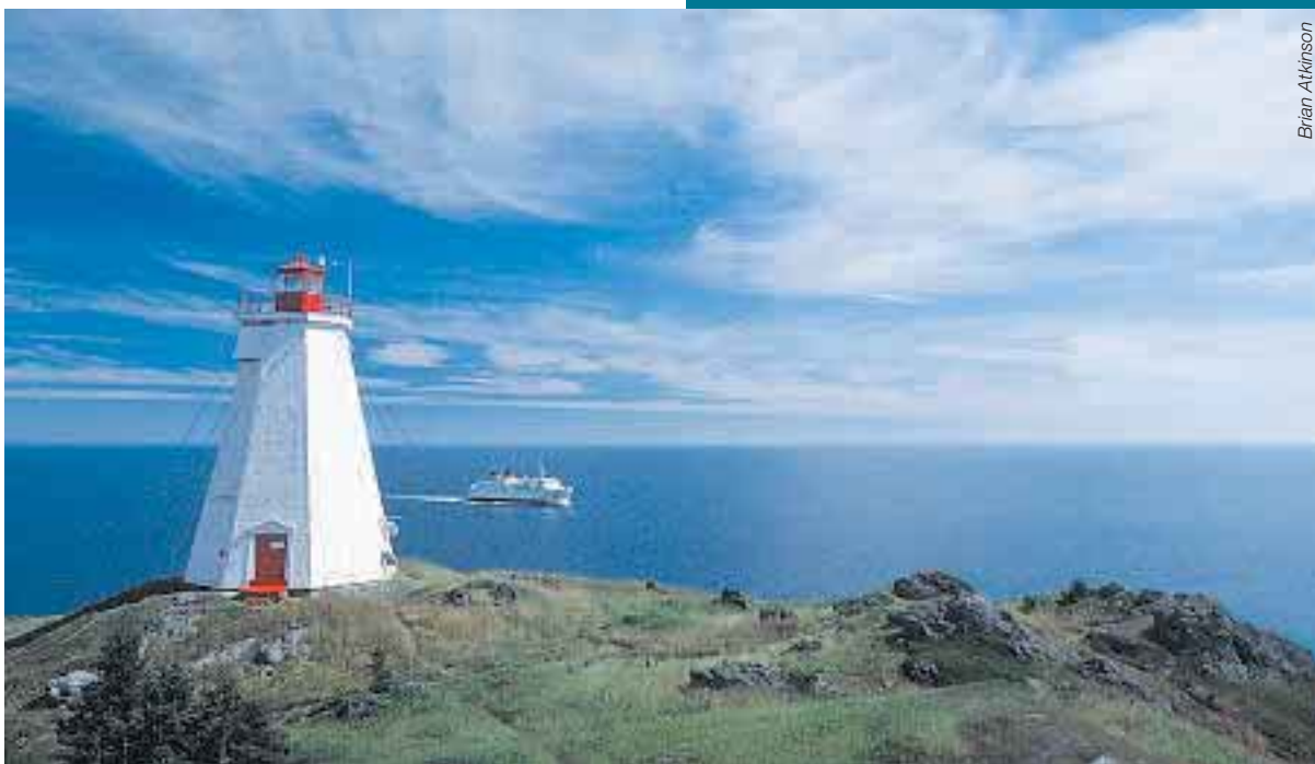
© L'île de Grand Manan, Bureau du tourisme du Nouveau-Brunswick

Les amateurs de farniente préféreront se prélasser sur les plages du littoral ou s'amuser dans les dunes de sable pendant que les visiteurs curieux iront se dégourdir les jambes dans la ville de Saint John. Mais tous devraient prendre le temps de savourer la cuisine locale en dégustant l'un des fameux homards de la région tout en goûtant à la légendaire gentillesse de ceux qui y habitent.