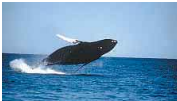
© Baleine franche, Bureau du tourisme du Nouveau-Brunswick