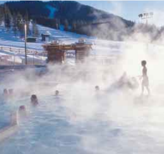
©Panorama mountain village